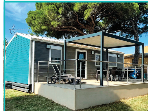
MOBIL HOME PREMIUM 3 Ch. / 5 Pers. - 38 m 2 + Lave-vaisselle