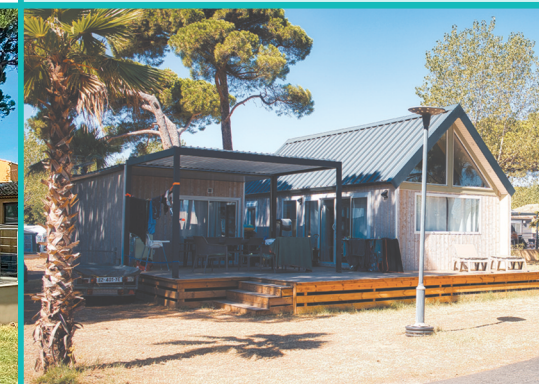
LOFT 2 Etages - 3 Ch. / 6 Pers. - > 60 m 2 + Lave-vaisselle + 2 voitures