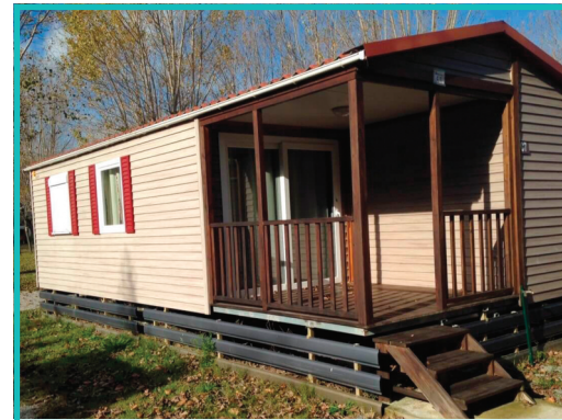
MOBIL ECO 2 chambres - 3 personnes 33 m 2