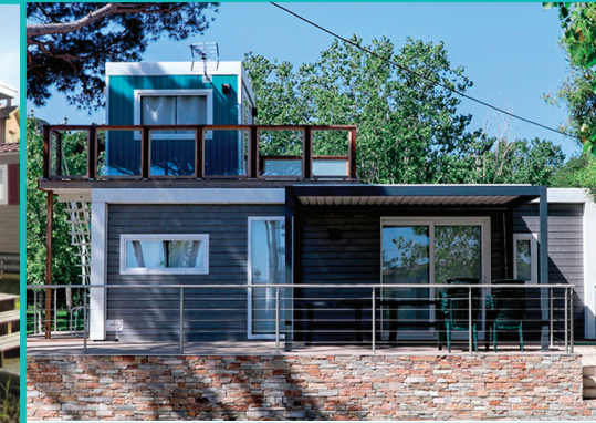
MOBIL HOME DUPLEX 2 Etages - 3 Ch. / 6 Pers. - > 50 m 2 + Lave-vaisselle + 2 voitures